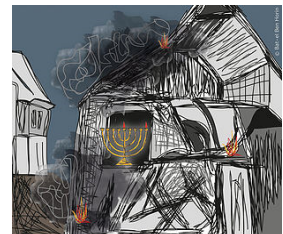
עיור אירוני | מה בווער?