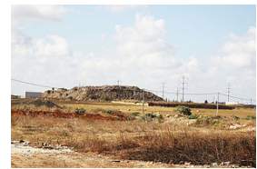
בונים על הזבל שלכם: לקראת מדיניות למיחזור פסולת בניין