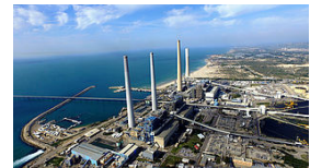
תמ"א 1: האתגרים, הסכנות ומבט קדימה