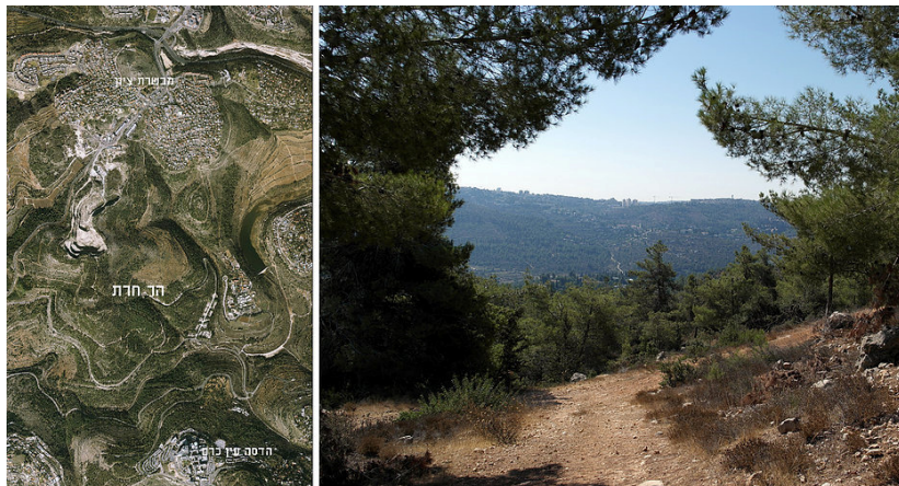
חלקים מתכנית הבנייה במערב ירושלים ('תכנית ספדי') שנדחתה בשנת 2007 מקודמים כיום במסגרת הותמ"ל, למרות הערכיות הגבוהה של השטחים הפתוחים. מבט אל עבר הר חרת.

על אף שמערכת התכנון בישראל איננה מושלמת והתהליכים בה לוקחים זמן רב, יצירת מסלולים עוקפי תכנון מהווה סכנה של ממש לאיכות החיים של תושבי ישראל. כאשר השיקול הכמותי, של מספר יחידות הדיור שנבנות, הוא השיקול המרכזי המוביל את מערכת התכנון, גוברת הסכנה שיחידות הדיור ייבנו באיכות נמוכה וללא סביבות מגורים ראויות הכוללות מענה לצרכי תחבורה, מוסדות ציבור, תעסוקה וכדומה.